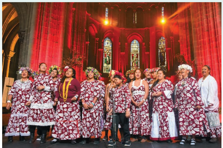
La joie du métissage, une chorale polynésienne lors d'un culte à la cathédrale de Genève (05.11.2017)

Le témoignage de proximité est confié aux paroisses. Sans l'échange avec d'autres, il risque de s'affaiblir, se décourager, s'éteindre. Il est donc essentiel de tourner son regard régulièrement vers l'ailleurs pour apprendre des autres, vivre des temps d'encouragement et d'édification mutuels. DM représente les Eglises et donc les paroisses des cantons romands et de langue française en Suisse allemande auprès de la Cevaa. DM apporte un soutien financier et participe à certains projets de cette communauté d'Eglises en mission. Ce trait d'union entre eux et nous est indispensable. En paroisse, nous n'avons ni les forces ni le temps de garder ce lien vivant. Alors profitons du travail de DM et en signe de reconnaissance, soutenons son engagement auprès de la Cevaa!