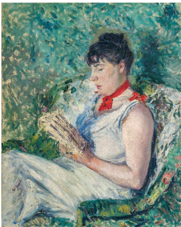
Portrait de femme assise lisant – © Christian Baraja

Entrée libre et gratuite – Apéritif – Quête.