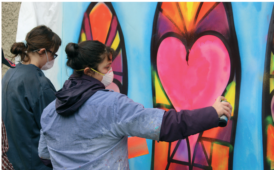
En 2017, porter des masques, pas pour le virus mais pour se protéger des aérosols.

Nous croyons en Dieu, ce qui ne change pas le quotidien, mais transforme notre regard et nous donne de le partager avec celles et ceux qui ont besoin de croire en l'avenir, nos enfants et nos jeunes.