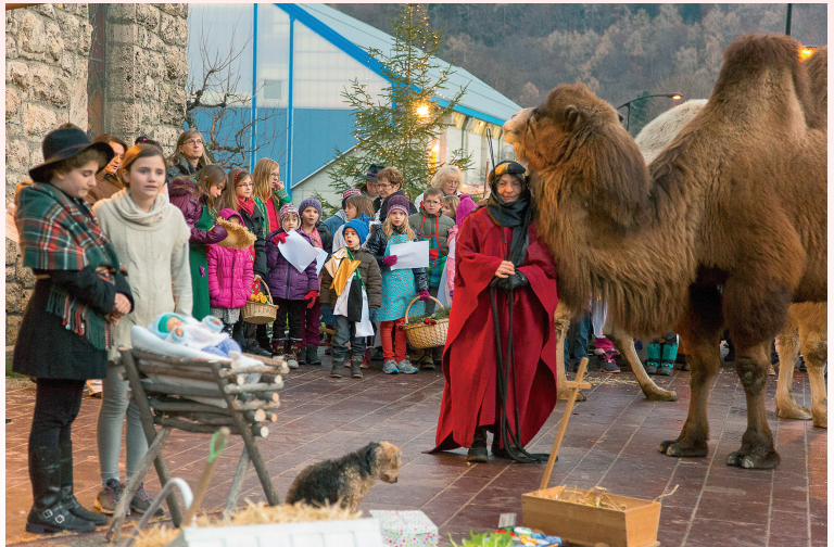
Fête de Noël des enfants, 2016

Un courrier a été envoyé aux parents vous demandant si votre/vos enfant(s) sont partant.e.s pour jouer un rôle et quelles dates de préparation sont envisagées.