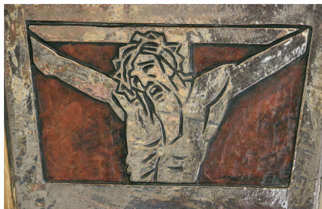
Crucifixion, baptistère du temple de Martigny

Exceptionnellement, notre culte paroissial du Vendredi saint, le 10 avril, à 20h , aura lieu à la chapelle de Saxon . Les textes qui seront lus et priés seront pour l'essentiel tirés de méditations rédigées par Mère Teresa et Frère Roger. Ce dernier, fondateur de la communauté œcuménique de Taizé, s'était rendu en Inde, à Calcutta, en 1976, pour y découvrir l'engagement de Mère Teresa auprès des enfants abandonnés et des mourants. Dix ans plus tard, ils ont écrit ensemble un «chemin de croix» bouleversant, et plein d'espérance et d'amour.