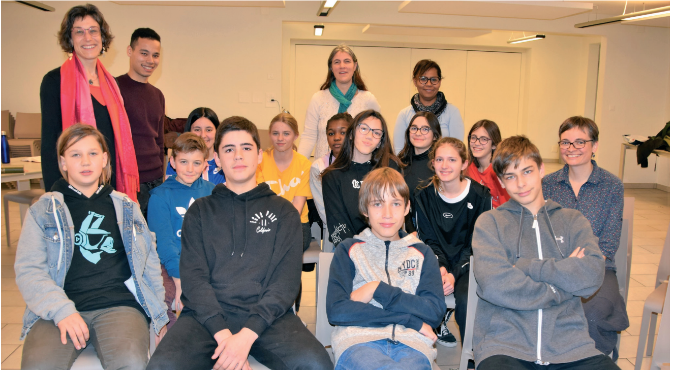
Une partie des catéchumènes et leurs accompagnants