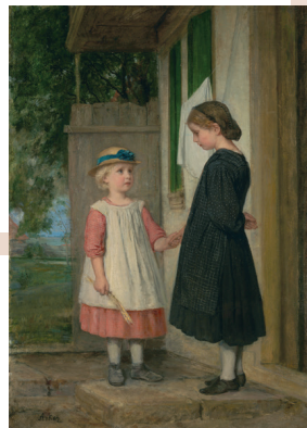
Albert Anker, « La petite amie », 1862