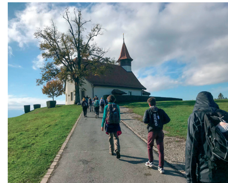
Une halte dans l'église des Croisettes